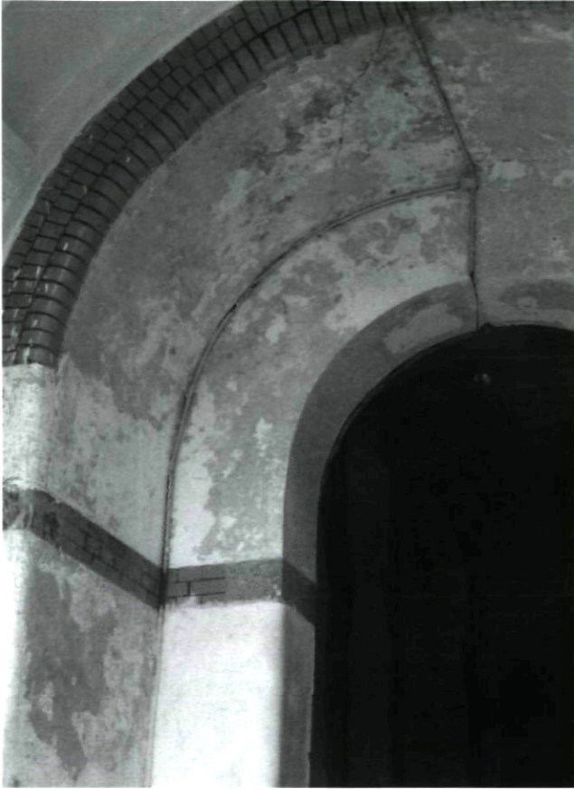
Afb. 6. Detail entree van het Kunstkringgebouw Jakarta (foto Arya Abieta, opname 2004)

constructieve en decoratieve elementen gerespecteerd worden of de authentieke situatie wordt teruggebracht. Hoewel Abieta in dit opzicht over voldoende kennis beschikt is niet uit te sluiten dat wensen van de opdrachtgever tot een daarvan afwijkend eindresultaat leiden. Een probleem dat nog wordt versterkt door het grotendeels ontbreken van historisch gegevens over het gebouw die bij de restauratie als referentie kunnen dienen. Een laatste, prangend probleem is dat nog geen beslissing is genomen over de functie van het herstelde gebouw. Het thans voorliggende voorstel het gebouw als hotel in gebruik te nemen strookt weliswaar met één van de voornemens (exploitatie door een particulier ondernemer) maar niet met een ander (openbare functie) en is bovendien nog verre van definitief. Het ontbreken van een beschrijving van de toekomstige functie van het gebouw plaatst de architect in een moeilijke positie: niet alleen immers moet hij ervoor zorgen dat het gebouw hersteld wordt, maar ook dat het na oplevering desnoods voor iedere gewenste functie bruikbaar is. Abieta cum suis staan derhalve voor een niet geringe opgave. Een opgave echter die, als ze goed wordt uitgevoerd, bevrediging zal schenken omdat het Kunstkringgebouw daarna weer zal zijn wat het ooit was: een ontmoetingsplaats en een baken in het stedelijk weefsel.