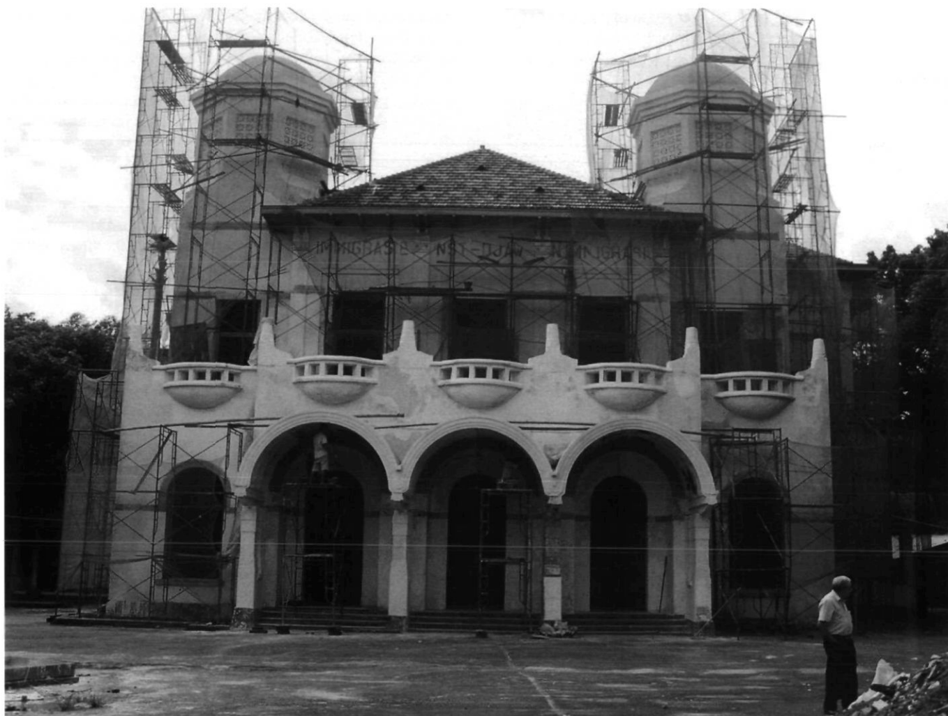
Afb. 4. Voorgevel van het Kunstkringgebouw (opname januari 2005)