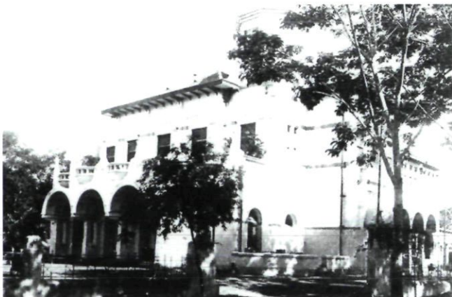
Afb. 1. Oude foto van de voor- en zijgevel van het gebouw voor de Nederlandsch-Indische Kunstkring (1914), Batavia van architect P.A.J. Moojen

Na zijn aankomst in de kolonie in 1903 vestigde Moojen na korte tijd zijn bureau in Batavia. Dit in tegenstelling tot de meeste ingenieurs die in dienst traden van een overheidsinstelling als het departement van Burgerlijke Openbare Werken. Vanwege zijn kennis, inzichten en opvattingen over architectuur en kunst waarvan hij zowel via zijn ontwerpen als via publicaties getuigde verwierf Moojen in korte tijd een vooraanstaande positie in vakkringen. Hij werd een van de grondleggers van een eigentijdse Indonesische bouwkunst en