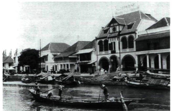
Afb. 2. Surabaya kantoorgebouw 'Levens- en Lijfrenteverzekeringsmaatschappij De Algemeene' (1900-1902), H.P. Berlage