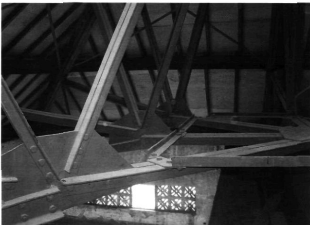
Afb. 3. Kunstkringgebouw Jakarta. Stalen kapconstructie (foto Arya Abieta, opname 2004)