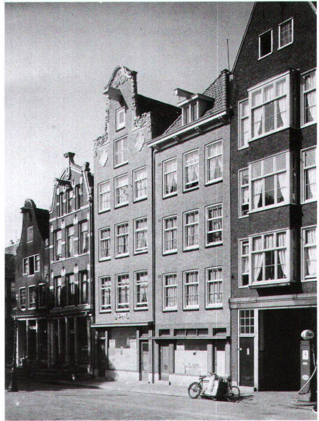
Afb. 6. Noordermarkt 37-40, 1939. Geheel rechts het ontwerp van J.H. Scheerboom

Van Hardeveld was het in grote lijnen eens met Boeken, maar in zijn nuchtere artikel werd de essentie van het probleem nog wat scherper geformuleerd. Naar zijn mening was de binnenstad als geheel een monument, een nationaal monument zelfs, de titel van het artikel gaf dat duidelijk aan: ‘Amsterdam als monument’. 23 In 1940 was die visie op de historische binnenstad nog niet gangbaar. In zijn commentaar op de gemeentelijke monumentenlijst had J.F. Slothouwer al gesuggereerd dat de grachtenwanden als geheel interessanter waren dan een aantal bijzondere grachtenhuizen. 24 Van Hardeveld ging nog een stap verder. Met de gemeentelijke monumentenverordening van 1926 en de omvangrijke Voorloopige Lijst der