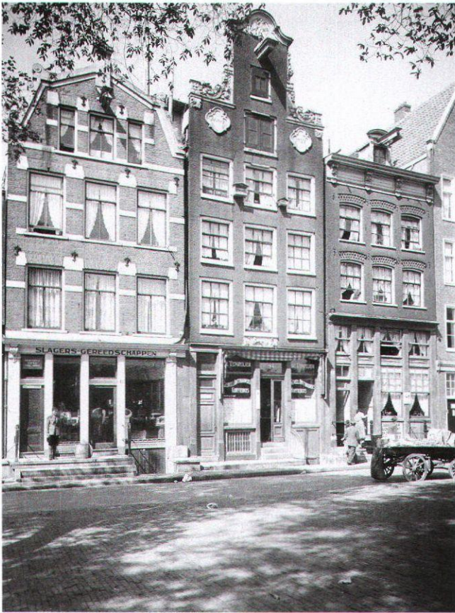
Afb. 5. Noordermarkt 37-40, 1936

een beter resultaat leidde. “Om op hun manier bij te dragen tot het stadsschoon, en ook om af te zijn van het maken van het eenige gevelgedeelte, dat toch iets van vorm hebben moet, namelijk het bovengedeelte, nemen deze ontwerpers dikwijls hun toevlucht tot het aanbrengen van oude gevelbekroningen of geveltoppen afkomstig van gesloopte perceelen. Ja, zulk een oplossing is dan meestal op zichzelf iets beter te aanvaarden dan de houten bekroning of griezelig harde geveltoppen, tot welke zij op eigen kracht zouden zijn gekomen. Dat dit evenwel niet de oplossing van het inderdaad belangrijke vraagstuk van de vervanging van verouderde perceelen is, behoeft hier wel geen betoog”.