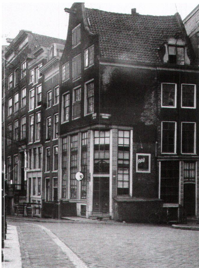
Afb. 7. Keizersgracht 464-Leidsegracht 29, ongedateerd

minder geslaagde voorbeelden. Leidsegracht 57 beschouwde hij als een goed voorbeeld, het blokje etagewoningen met drie oude toppen aan de Palmgracht kreeg geen voldoende. Het beeld van meerdere 'Van Houten panden' naast elkaar, zoals aan de Rozengracht en in de Rozenstraat, beviel hem evenmin. Ook zestig jaar later begrijpt de waarnemer nog heel goed wat hij bedoelde, al verschuift dit esthetisch oordeel langzaam naar architectuurhistorische waardering. Hetzelfde geldt voor de restauraties die bekritiseerd worden. Het artikel was geïllustreerd met vele duo afbeeldingen: oud en nieuw, waarbij de 'Van Houten panden' al dan niet moedwillig vermengd werden met restauraties. Soms zijn de verschillen moeilijk zichtbaar. "Intussen", aldus Van Hardeveld, "hoe- de men zich voor overdrijving".