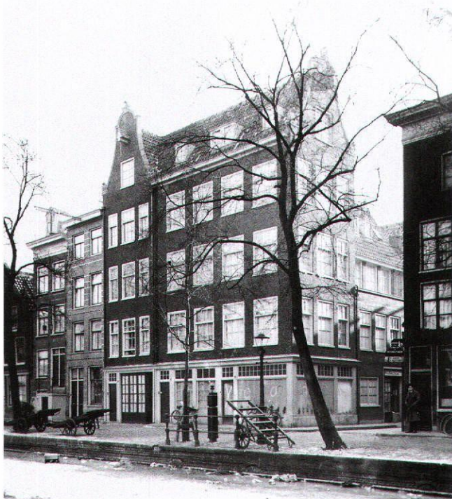
Afb. 3. Egelantiersgracht 191-193-195, ongedateerd, vermoedelijk 1933