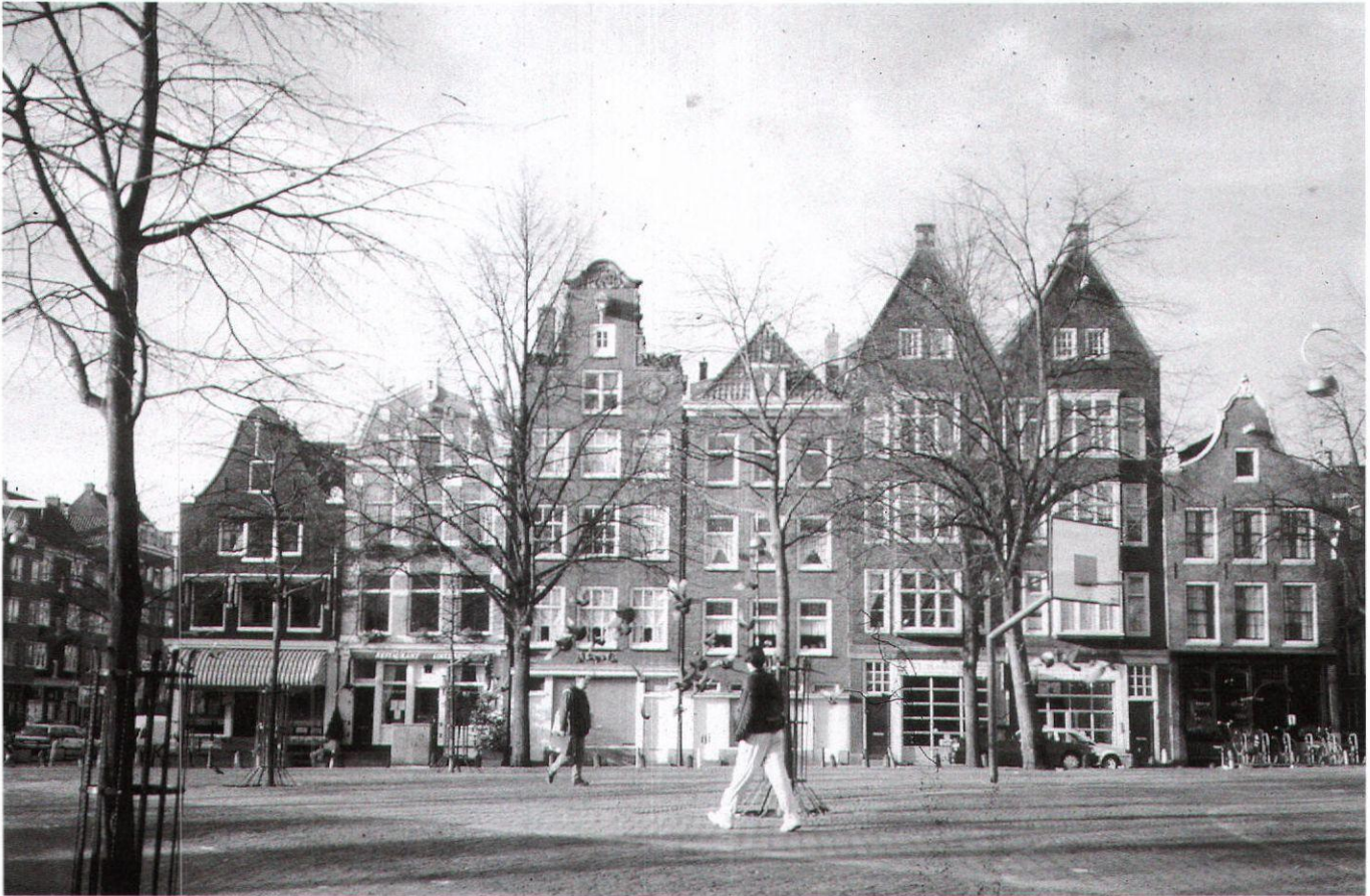
Afb. 4. Noordermarkt 34-43 (nummering gaat van rechts naar links), omstreeks 2000