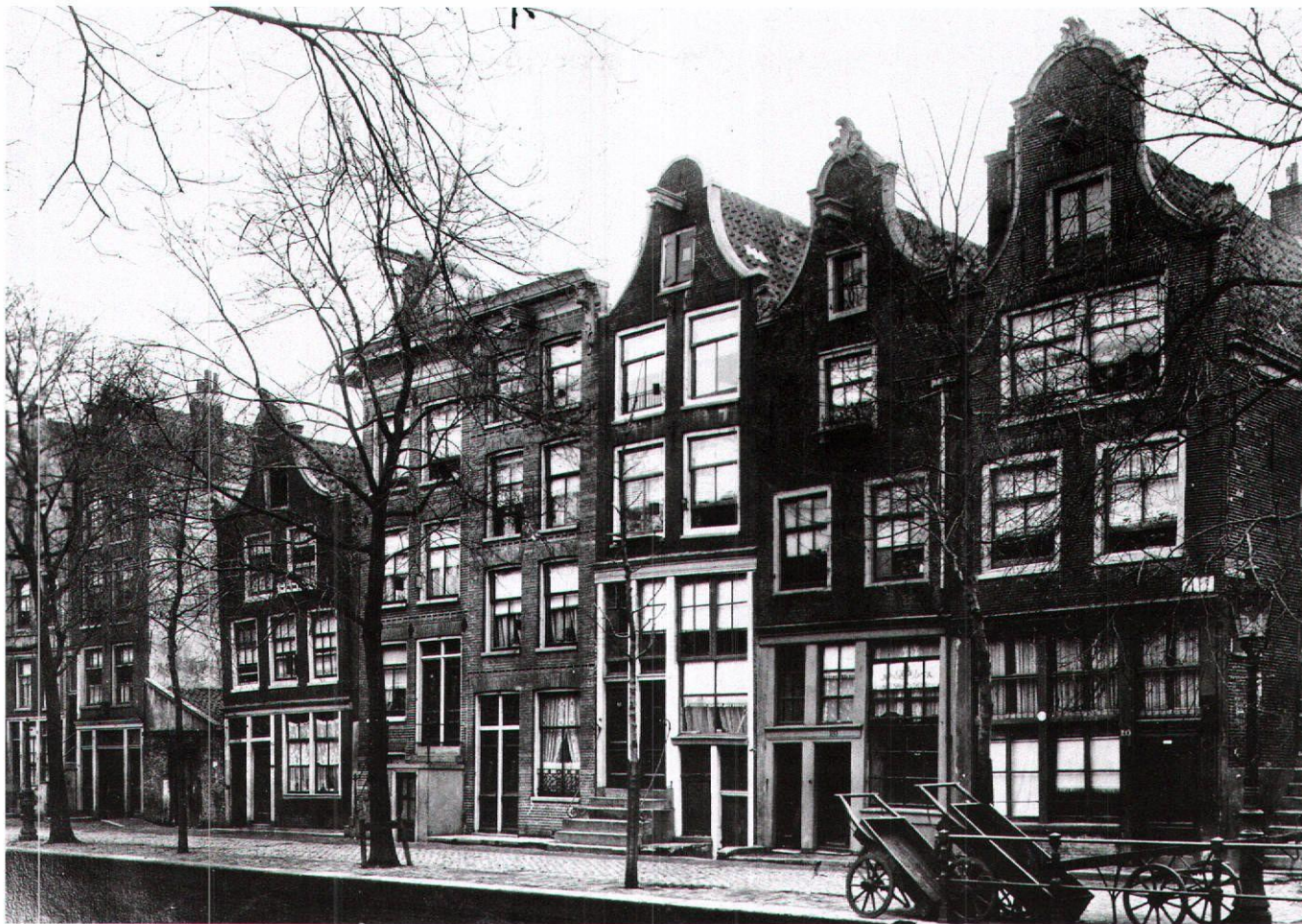
Afb. 2. Egelantiersgracht 191-193-195, ongedateerd, vermoedelijk 1931