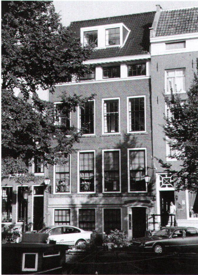
Afb. 9. Keizersgracht 11-13

krijgbaar en pittig geprijsd. Misschien wordt het tijd voor een nieuwe en ongeroetoucheerde architectuurgeschiedenis.