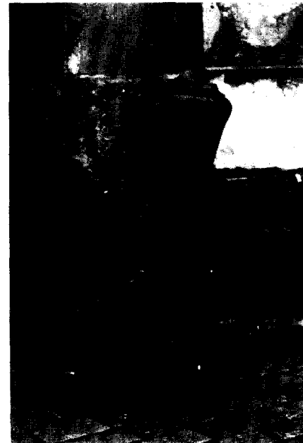
Wolwevershaven, gezicht op de noordzijde.

De hoofddoelstelling van het Basisplan, sanering van de binnenstad, bleek evenwel onbereikbaar te zijn. Onder druk van de plaatselijke bevolking en gesteund door de landelijke politiek formuleerde de gemeente in de loop van de jaren 70 nieuwe punten van beleid: de woonfunctie terug in de binnenstad, kleinschalige invullingen (nieuwbouw) en planmatige uitvoering van rehabilitatieprojecten, waaronder woonhuisrestauraties. De basis werd gelegd voor concrete uitvoeringsplannen, ook met betrekking tot de monumenten. Eerst een intentieverklaring van de gemeenteraad voor het beschermde stadsgezicht (26 oktober 1976), vervolgens een meerjarenprogramma voor de restauratie en rehabilitatie van de woonhuismonumenten (600 à 900 panden in 10 jaar), en een schema voor het herstel van de bijzondere (grote) monumenten.