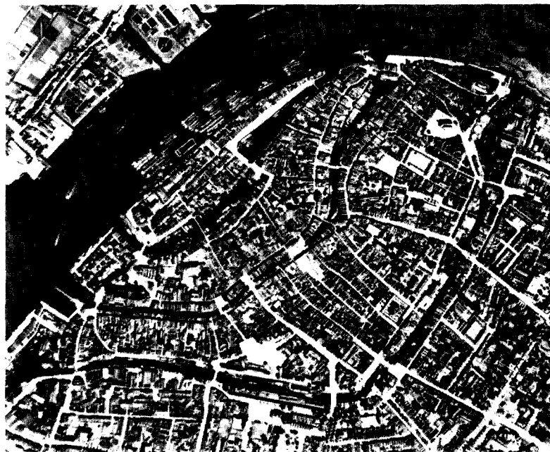
Afb. 2.2 Luchtfoto 1933

Het herstel van 900 panden betekende dat ongeveer \frac{1}{3} van de gehele bouwvoorraad van de Dordtse binnenstad (ca. 2600 panden) in aanmerking kwam voor herstel. Het stadsbeeld van J. Eijkelboom ('stutten, die ook alweer