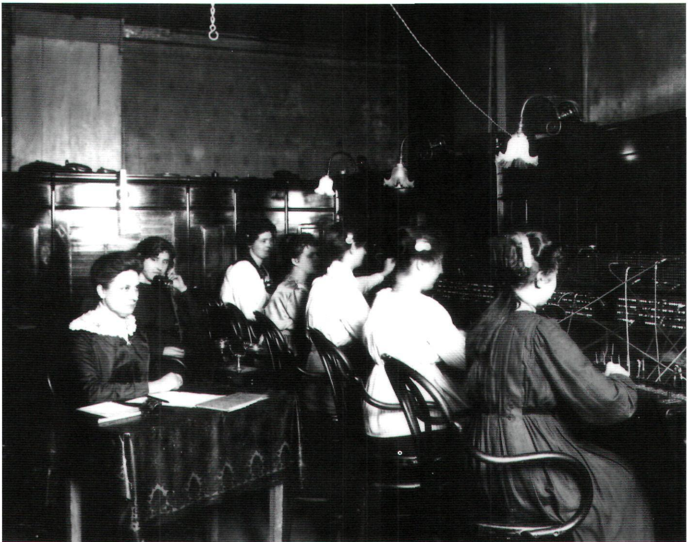
Afb. 9. De seinzaal van het Centraal Telefoonbureau van de firma Ribbink van Bork & Co/A.T.M. op de verdieping van het pand Papengracht 23, met zes telefonistes en een cheffin. (Uit: Steensma 1918 (zie noot 1), afb. [16])

legd; de abonnementsprijs zou niet worden gewijzigd; aan de gemeente zou 5% van het totale aantal aansluitingen - met een minimum van 25 - gratis ter beschikking worden gesteld van de gemeente; de concessie zou met dertig jaar worden verlengd tot 1 maart 1935. In januari 1902 nam b&w contact op met de heer Theunissen, directeur van de gemeentelijke telefoondienst te Amsterdam, met een aantal vragen. De gemeente vroeg zich namelijk of het financieel interessant zou zijn om de concessie niet te verlengen maar de exploitatie in eigen hand te nemen. De heer Theunissen antwoordde in juli van dat jaar. Hij achtte zo'n constructie heel wel mogelijk, adviseerde om in eigen beheer een compleet nieuw bovengronds net aan te leggen en daarom niets van het bestaande net over te nemen. Een eigen gemeentelijk telefoonnet zou al op korte termijn zeer lucratief kunnen zijn voor Leiden, aldus Theunissen. Ook de directeur Gemeentewerken van de gemeente Leiden werd om een reactie gevraagd op het