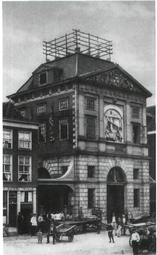
Afb. 6. Het waaggebouw in Leiden met de dakstelling van de lokale telefonie. Toestand 1895-1905. De dakstelling is van het tweede type met een gering aantal dwarslatten

De gemeenteraad van Leiden verleende in haar vergadering van 21 januari 1886, met zeventien stemmen vóór en vijf stemmen tegen, goedkeuring aan het verzoek van de firma