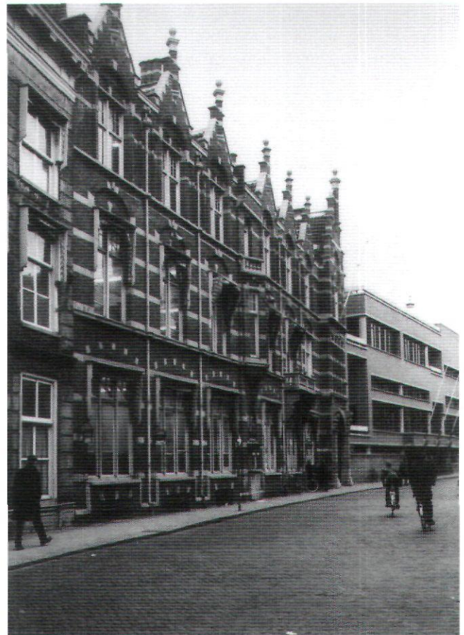
Afb. 11. De voorgevel van het postgebouw aan de Breestraat na de verbouwing van 1918-1921. Toestand 1921-1976

Op de eerste verdieping veranderde er weinig. De postdirecteur behield zijn drie woonkamers en de keuken aan de straatkant, waarvan twee en-suite, en aan de achterkant twee van de drie slaapkamers en de badkamer. Ook de vier kamers op