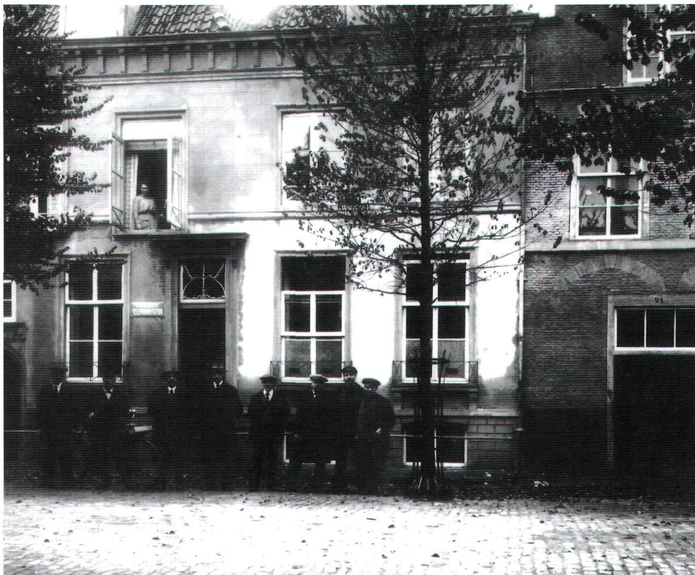
Afb. 8. Het Centraal Telefoonbureau van de firma Ribbink van Bork & Co, sinds 1899 Algemeene Telefoon Maatschappij (A.T.M.), was ondergebracht op de verdieping van het pand Papengracht 23, 1905-1923. De foto van het gebouw en het mannelijk personeel dateert uit 1918.

Zoals vermeld liep de concessie aan de ATM liep af op 1 maart 1905. Al in het najaar van 1903 kwam de eventuele