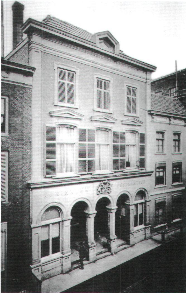
Afb. 1. Het postgebouw aan de Breestraat. Toestand 1872-1895