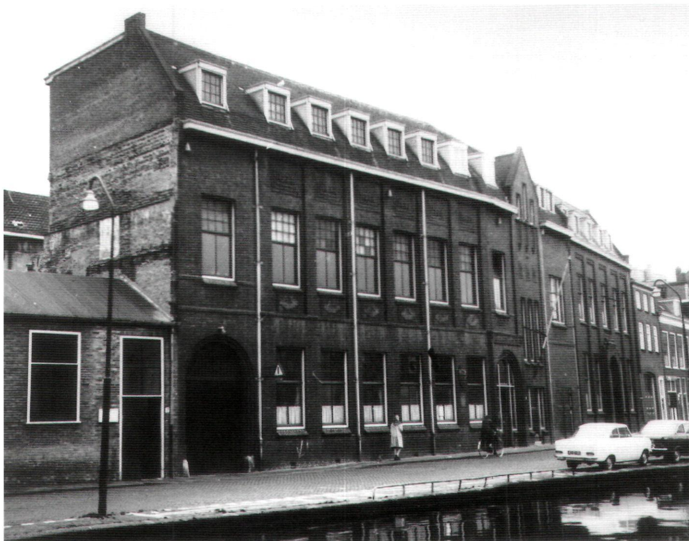
Afb. 10. De voorgevel van het nieuwe telegraaf- en telefoongebouw aan de Bloemmarkt. Toestand 1921-1976

Het ministerie van Onderwijs, Kunsten en Wetenschappen, de eigenaar van nummer 21, was daartoe bereid, maar de eigenaar van nummer 23 was minder welwillend. Eerst was hij daartoe niet bereid, maar later weer wel, maar nu vroeg hij een jaarlijkse huurprijs die bijna het dubbele was van die van de voorafgaande jaren. Na enig onderhandelen en het iets verlagen van de huurprijs – hoewel die nog steeds de helft hoger was dan vroeger – besloot het rijk de nieuwe huurprijs te accepteren. Het verplaatsen van de telefooncentrale en de infrastructuur naar een andere locatie voor een periode van