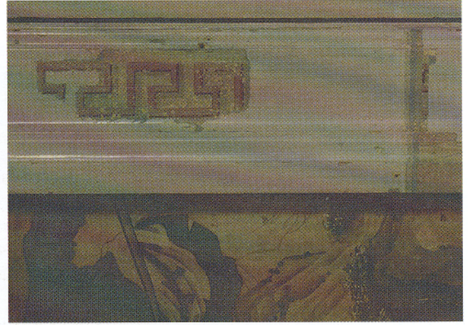
Afb. 12. Vrijgelegde chinoiserie schildering op de kamerbetimmering, rechter deur en deurkozijn noordwand Chinese Salon.

had plaatsgevonden. Er werd het voorstel gedaan om een redelijk bewaard gebleven representatief stuk van ongeveer een halve meter te behouden en de rest van de koofschildering te reconstrueren. Maar zelfs een dergelijk klein stuk was in de koof niet meer te vinden. In de afweging tussen behoud en reconstructie is besloten eerst de grijze overschildering van de gehele kooflijst te verwijderen, waarbij zoveel mogelijk van de verflagen worden behouden. Daarna zou worden bezien of een gehele of gedeeltelijke aanvullende schildering uitgevoerd moet en kan worden. Er is echter gekozen de ontbrekende schildering van de palmet- en leliemotieven niet aan te vullen maar wel de doorlopende lijnen. De lacunes werden in dezelfde crème-keurige achtergrondtoon geschilderd.