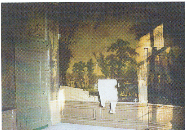
Afb. 3. De Oudhollandse kamer in 1993, voor de restauratie.