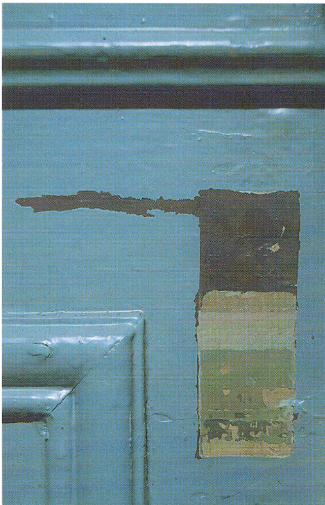
Afb. 10. Stratigrafie of kleurentrap van de verflagen op de lambrizing in de Oudhollandse kamer.

De betimmeringen in de Fazantenkamer en de Oudhollandse kamer zijn handmatig licht opgeschuurd om vooral het historisch verflagenarchief niet te verstoren. 15 Hierop is als isolatielaag een lichtgrijze alkyd grondverf aangebracht. In de Fazantenkamer is het houtwerk met een tweede laag alkydverf in een beige ondertoon geschilderd waarop een lijnolieverf met loodwit toegepast. Er is eerst een proefvlak op de lambrizing opgezet en na instemming met het resultaat volgde de rest van de Fazantenkamer. Aan de verf werden krijt, rauwe lijnolie en terpentine toegevoegd. 16 Met de lijnolie en de terpentine werd de verf verdund en schraler gemaakt. Het krijt diende weer als vulmiddel om een te vloeiende en te