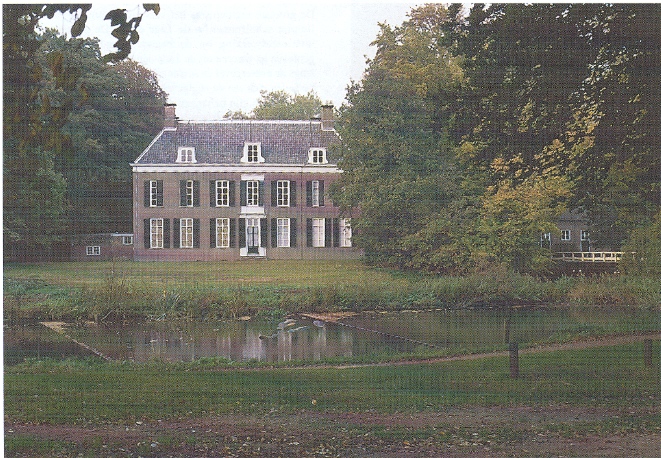
Afb. 1. Oud-Amelisweerd 1999, zuidgevel aan de Kromme Rijn.

van de beschilderde wandbetimmeringen om de kleurrijke geschiedenis van vier kamers op de begane grond in kaart te brengen. Daarnaast werden de behangsels in deze kamers gedocumenteerd en is de conditie ervan onderzocht. Op basis van de onderzoeksresultaten is toen een behandelingsvoorstel opgesteld. 1 In de periode tussen oktober 1997 en juni 1998 kon de verstaalslag worden gemaakt van onderzoek naar restauratie die gedeeltelijk door de SRAL werd uitgevoerd. 2 In dit artikel wordt ingegaan op de restauratie van het beschilderd interieur van twee kamers; de zogenaamde 'Oudhollandse kamer' en de 'Fazantenkamer'.