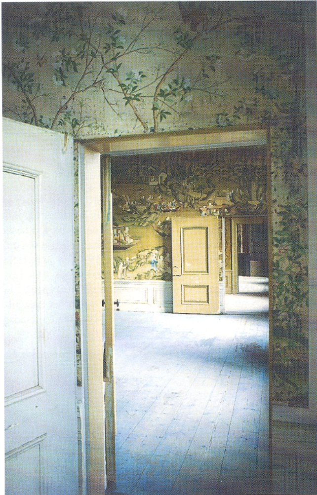
Afb. 2. De vier kamers enfilade aan de zuidgevel, doorkijk van oost naar west.