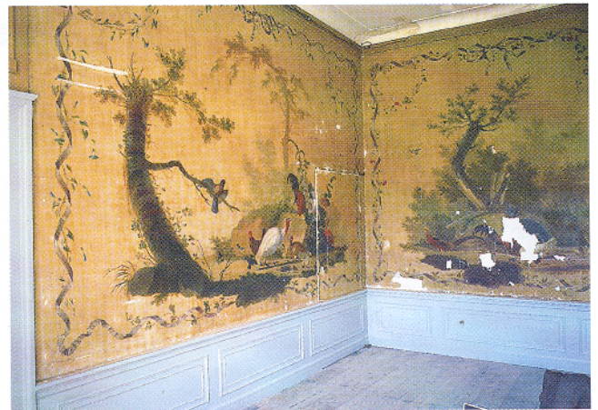
Afb. 4. De Fazantenkamer in 1997, tijdens de restauratie.