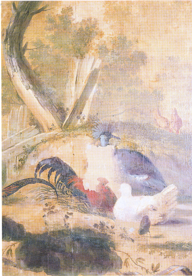
Afb. 5. Fazantenkamer: retoucheer-optie 3, kleurtoetsen van fijne penseelstreepjes in verticale richting.

schilderstijl van het behang. De eerste optie werd positief beoordeeld. Door de intoning is de lacune geen storend element meer en krijgt de bezoeker gelegenheid het behang te bekijken zonder afgeleid te worden. Toch wordt de beschouwer