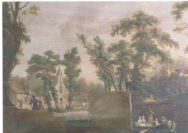
Afb. 7. Oudhollandse kamer: retoucheer-optie 1, de 'vlekkenoptie' in bruine olieverf glacerend opgezet.

schilderstijl van het behang. De eerste optie werd positief beoordeeld. Door de intoning is de lacune geen storend element meer en krijgt de bezoeker gelegenheid het behang te bekijken zonder afgeleid te worden. Toch wordt de beschouwer