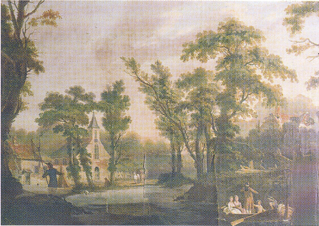
Afb. 8. Oudhollandse kamer: retoucheer-optie 3, formele reconstructie waarbij de compositie wordt nagebootst en aangevuld met een voorplan, middenplan, horizon en repoussoirs.

Er kon niet volstaan worden met een monochrome kleur, noch het intonen naar de omgevingskleur of een 'vlekken-optie'. De eerste optie bleek onvoldoende, het storende element van de rechte beeldafsnijding werd weliswaar iets verdoezeld maar de vlek werd er niet kleiner door. Voor een overtuigende invulling van de lacune moest in ieder geval de compositie van de omringende, originele schildering een logische beëindiging krijgen. Het was lastig een keuze te maken uit de drie overgebleven opties vanwege het schetsmatige karakter en de grote onderlinge verschillen. Er is dan ook niet voor één bepaalde optie gekozen maar voor een combinatie van elementen uit de laatste drie opties. Tijdens de discussie hierover bleek hoe zinvol het was geweest de opties op folie te zetten. Bij het bereiken van consensus over de uit te voeren retouche, of beter gezegd de (in-)schildering, waren de folies bijzonder nuttig. Hierdoor konden de verschillende mogelijkheden beter met elkaar vergeleken en besproken worden. De folies en aanbevelingen samen dienden als leidraad bij het inschilderen.