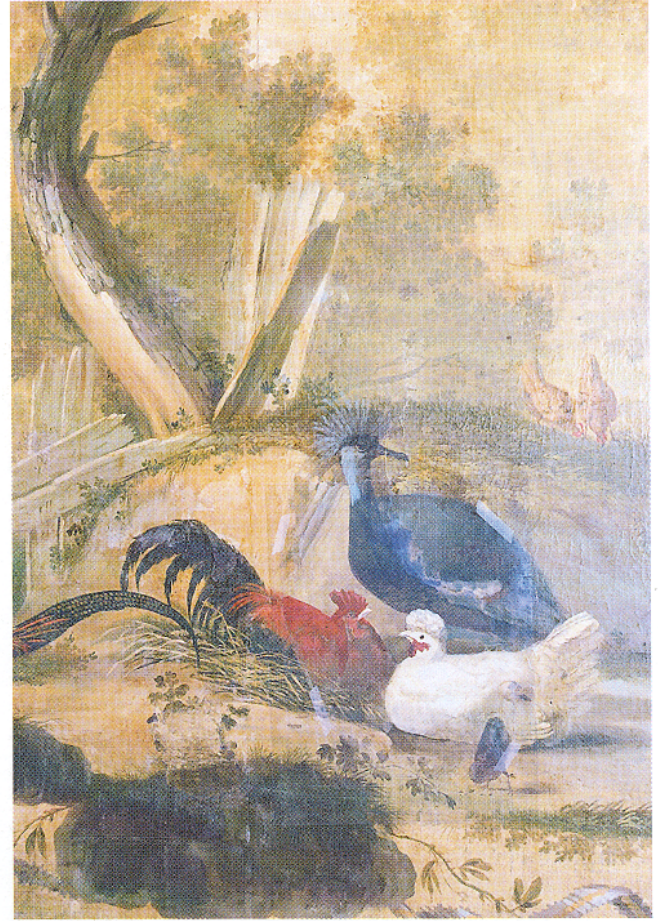
Afb. 6. Fazantenkamer: retoucheer-optie 4, integrale retouche waarbij de voorstelling wordt gecompleteerd.

niet misleid en kan de lacune gemakkelijk herkend worden. De eerste optie is uitgevoerd. Na voltooiing en oplevering in 1998 werden een dia en een foto gevonden waarop het nu ontbrekende nestelende pluimvee afgebeeld is. Hierdoor zou thans een integrale retouche ethisch te verantwoorden zijn.