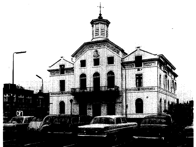
Afb. 3. Stadhuis van Zaandam.