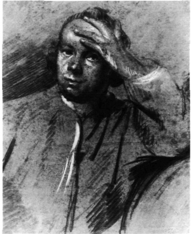
Afb. 4. Zelfportret van Cornelis Ploos van Amstel op veertigjarige leeftijd. 1766. Tekening, Gemeentearchief Amsterdam, Historisch-topografische atlas.

"Door deeze middelen zal men in staat gesteld worden, om veele misslagen, welke thans zekerlyk in sommigen onzer Gebouwen heerschen, te overwinnen; men zal het Oordeel by het Vernuft plaats, en zekerlyk de beste, dat is de bekende vyf Regels van Bouworde volgen, om een Gebouw zodanig te stigten, dat het, in zyne deelen, en te samen in zyn geheel, voldoe aan het einde dat men zich heeft voorgesteld: namentlyk sterkte, en beantwoording aan deszelfs oogmerk, met vermyding van het overtollige, eene gepaste spaarzaamheid, en zo veele uit en inwendige schoonheden als noodig zyn, om onze aandacht te trekken, en behaagen te verwekken. Want wat de nieuwe Smaak van de Huizen onzer Eeuwe aangaat, wy kunnen dezelve met den Schryver geen verbeteringen noemen, om dat men den Italiaanschen Smaak verliet, en, zonder op eenige Bouworde agt te geeven, te werk ging; want