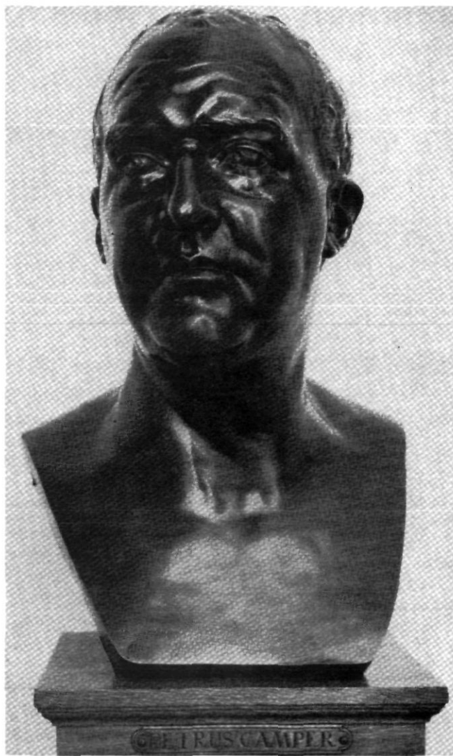
Afb. 3. Bronzen borstbeeld van Petrus Camper door Marie-Anne Falconet-Collot, 1781, collectie Rijksuniversiteit Groningen.