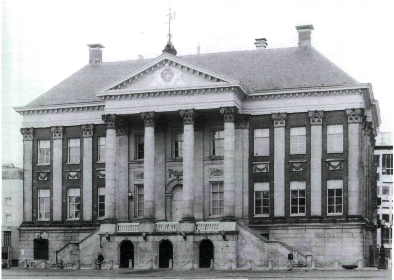
Afb. 10. Stadhuis van Groningen.

persoonlijke artistieke voorkeuren en prestaties tot nu toe. Van Camper had Husly namelijk precies die taak gekregen die hij in 1767 al voor een architect gereserveerd had en die hem toen door Ploos van Amstel was verweten: als, in Ploos' bewoordingen, één van de kunstenaars, 'die alleen bekwaame handen moeten hebben, om de denkbeelden, die anderen door het lezen dier Boeken, gekreegen hebben, uit te voeren'. 109 Wellicht ook was Camper beide opvattingen tegelijk toegegaan, en beoordeelde hij juist op grond van Weesp Husly als de ideale uitvoerder van zijn eigen sturende hand.