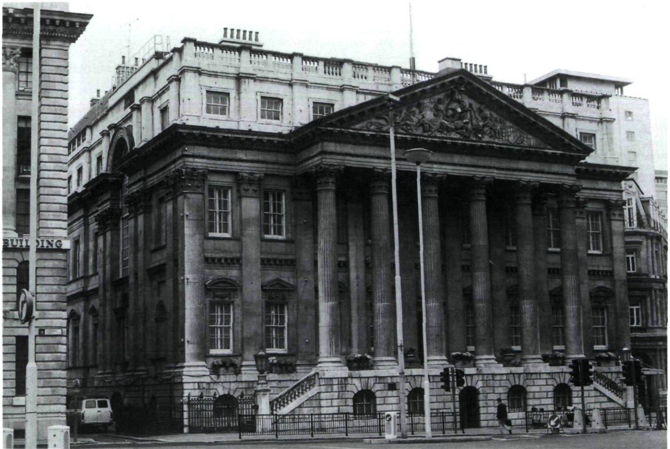
Afb. 7. Mansion House, Londen, 1737 e.v.

Camper had duidelijk meer gemeen met een kritisch Frans toerist als Laugier dan met het minder kritisch soort Nederlandse kunstliefhebber van het type Ploos. Camper zowel als Laugier waren er op uit om de tekortkomingen van de architectuur in eigen land aan de kaak te stellen. Dat blijkt wel duidelijk uit de wijze waarop beide critici zich uitlieten over de eigen nationale 'topmonumenten'. Terwijl Camper het meest bejubelde gebouw in de Republiek tot toetssteen voor de rest van Nederland maakte, had Laugier een vergelijkbare aanpak gehanteerd voor de Franse architectuur. Versailles, het Louvre en andere paleizen en Parijse woonhuizen, plus vrijwel de gehele Franse kerkarchitectuur, dienden Laugier