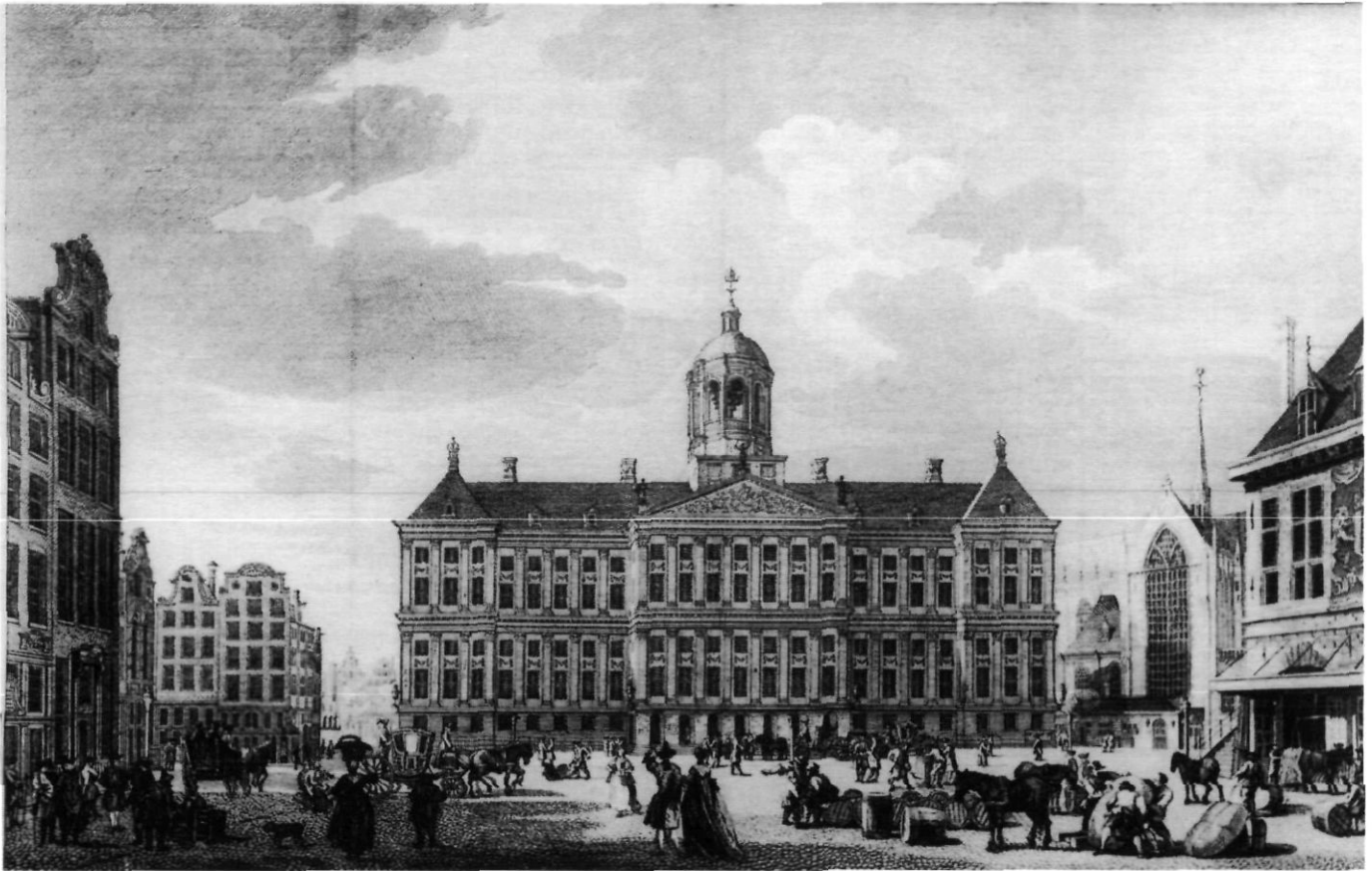
Afb. 2. Het stadhuis van Amsterdam. Gravure uit [C. Ploos van Amstel], De bouworde van 't Stadhuis van Amsterdam, en de Smaak der Nederlanderen, ten opzigte der Konsten en Weetenschappen, verdedigd, tegen de ongegronde berispingen van den Heer C., in zynen brief aan den Filosooph, Amsterdam 1767.

we Venster-raamen, groote Schoorsteenmantels, en ruime Vertrekken der oude; en weder integendeel aan de groote Vensterraamen, platte Gevels, ruime Trappen en bekrompen Vertrekken der latere Gebouwen gestooten te hebben; schoon de eersten, naar den Smaak der Italiaanen, de oude Meesters der Bouwkonst, en de anderen naar het voorbeeld der Franschen, anderszins den goeden Smaak met de Engelschen gemeen hebbende, gezegd worden gebouwd te zyn, en de Schryver zelf niet schynt te weten, hoe hy het hebben wilde”. 39