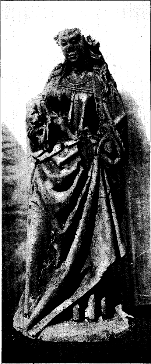
MADONNA MET KIND. N o . 3, bl. 191.