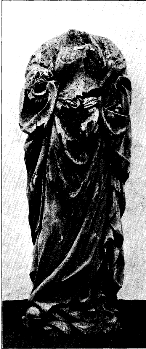
VROUWELIJKE HEILIGE. N o . 11, bl. 194.