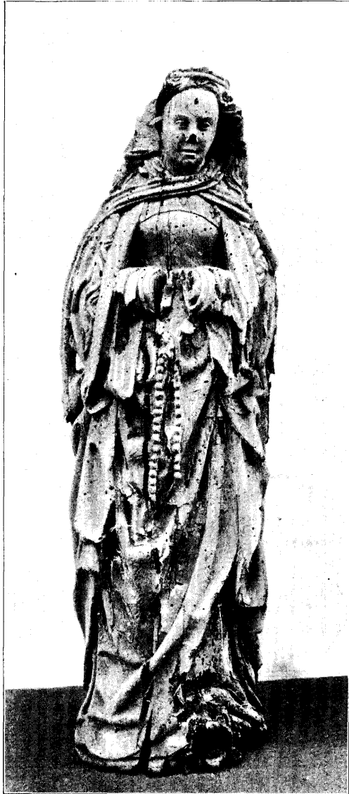
VROUWELIJKE HEILIGE. No. 10, bl. 194.