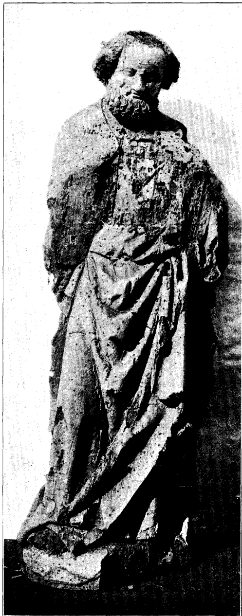
H. PETRUS. N o . 4, bl. 191.