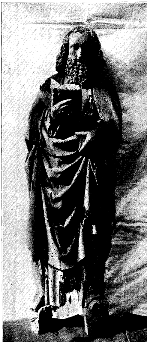
H. PAULUS. N o . 5, bl. 191.