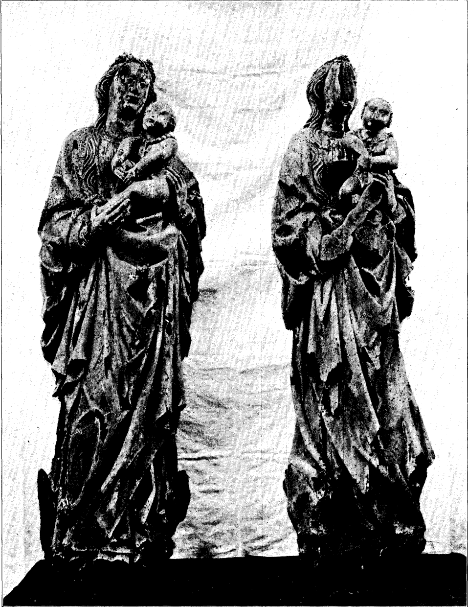
MARIANUM, VOOR- EN ACHTERZIJDE. N o . 9, bl. 193.