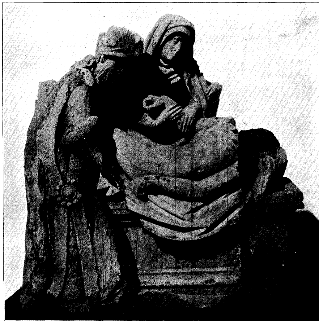
GRAFLEGGING. N o . 14, bl. 195.