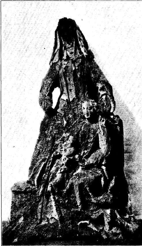
H. ANNA MET MARIA EN KIND. N o . 2, bl. 190.

Gaarne betuigen wij onzen vriendelijken dank aan den Heer Ed. Cuypers voor het zoo welwillend verleend gebruik van de clichés.