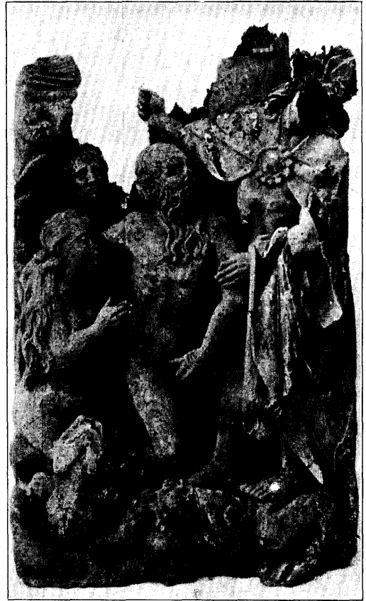
CHRISTUS IN DE VOORHEL. (LIMBUS). N o . 13, bl. 195.