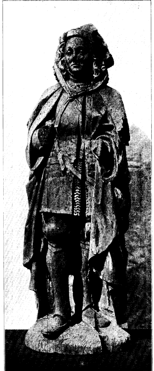
RIDDERFIGUUR (H. ADRIANUS?). N o . 8, bl. 193.