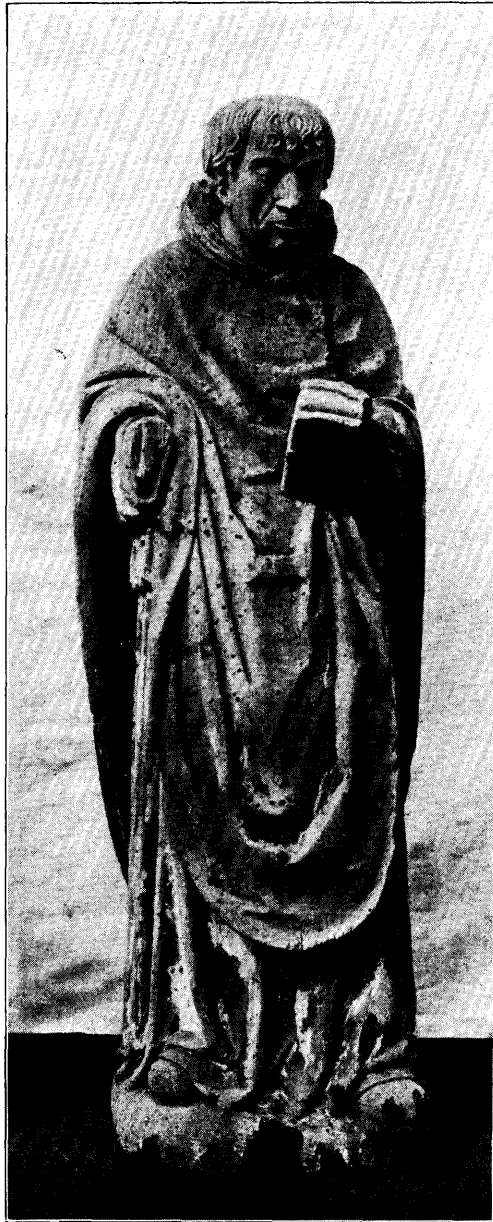
PRIESTER MET BOEK. N o . 7, bl. 193.