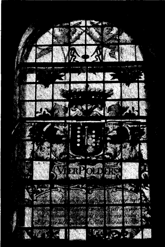
Kerkraam te Vierpolders.

Aardrijkskundig Woordenboek, een aantal dorpskerken met rijk met wapens versierde ramen, doch slechts weinige hiervan zijn tot heden bewaard gebleven. Enkele kerk-