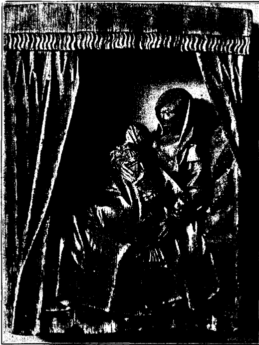
Uit de collectie Bisschop.

tabaksdoozen. Reproducties in gips, die ten geschenke ontvangen werden van dengeen, die een mooi stuk zilver enz. had mogen laten afgieten, kwamen naast de origineelen. Mooie gave dingen: messen, lepels, lijfsieraden enz. raakten bedolven onder defecte en roestige exemplaren, uit vaarten opgevischt of uit den bodem opgegraven. Geschilderde familieportretten, soms van goede kwaliteit of voorstellende personen van beteekenis, dikwijls echter van onbekende artiesten van geen rang, stukken die men in zijn eigen huis al lang naar den zolder zou verbannen hebben, vervolgd den bezoeker, waarheen hij zijn schreden ook richtte; zelfs de wanden van de terp-afdeelingen hingen er vol mede.