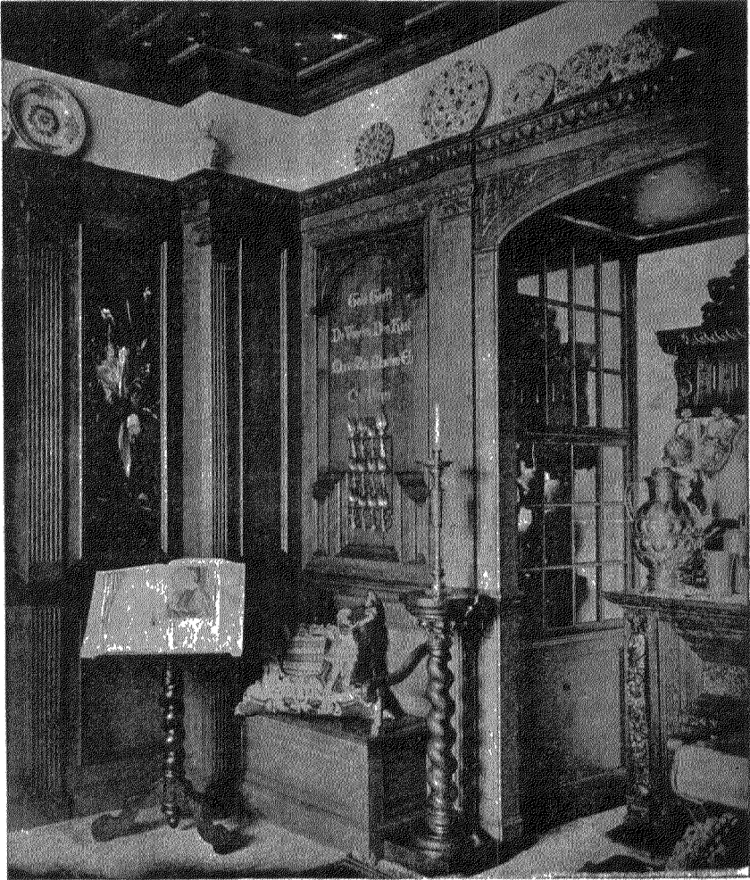
Gezicht in de eetkamer van villa Frisia.

Naar aanleiding van deze belangrijke en veel ruimte vorderende