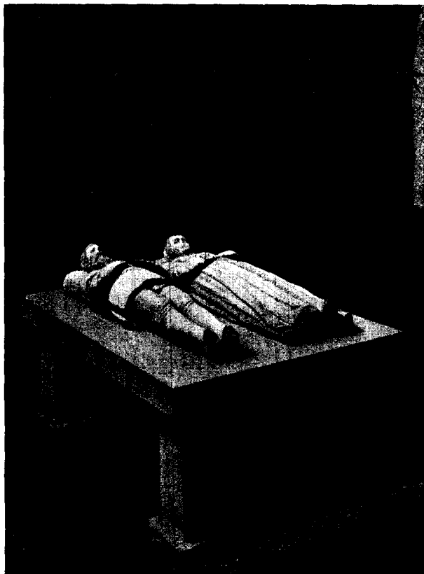
Het herstelde grafmonument in de N. II. Kerk te Amerongen.

toevallig in het Amerongsche kerkkoor op den grond had zien liggen, ernstig twijfelde aan de identiteit van het beeld met de tombe, waarvan hem later het processtuk sprak, — hoewel toch de gelijkenis van den voorgestelden persoon (niet alleen afgebeeld op eene geschilderde memorie-tafel op het kasteel Amerongen, maar ook op den hoogst zeldzamen, hier gereproduceerden zilveren penning in het Stedelijk museum van oudheden te Utrecht) onmiskenbaar heeten