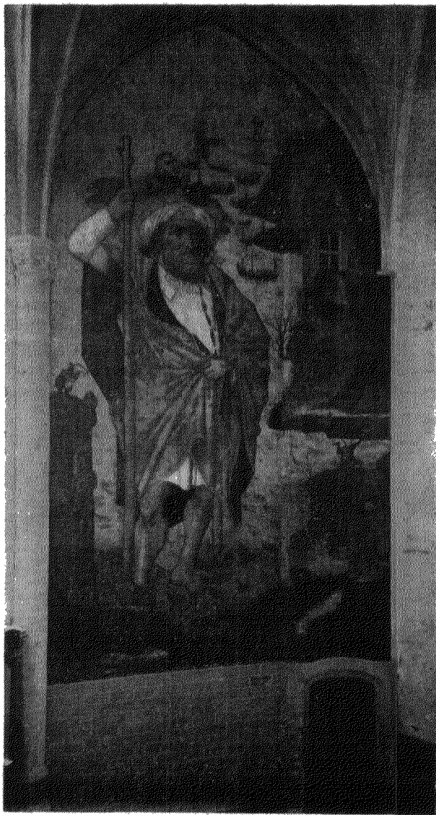
Nieuw ontdekte muurschildering in de Groote Kerk te Breda.

dit muurvak tot in den top van den gewelfboog is 10 20 M. en de breedte 4.60 M. De schildering vangt evenwel aan ter hoogte van 2.20 M. boven den