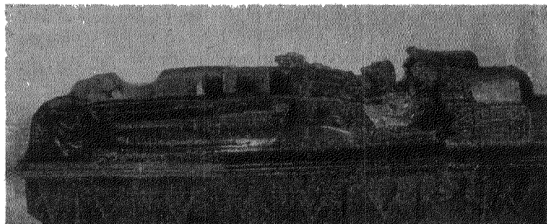
Praalgraf in de N. II. kerk te Geervliet.

De contreforten, van indiepingen voorzien, zijn hart op hart gemeten 30 tot 33 c.M. van elkander verwijderd; die naast de buitenste vakken echter 21 c.M., zoodat de buitenste vakken smaller zijn dan de overige.